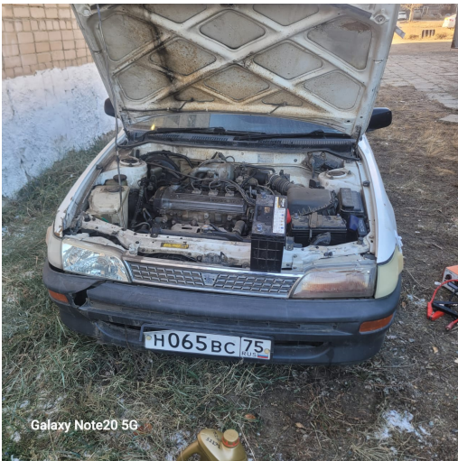
Galaxy Note20 5G