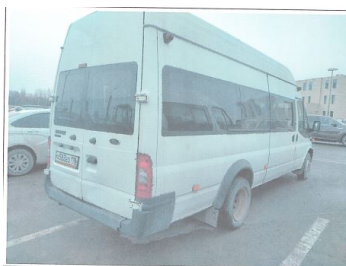
Фото 3. Общий вид