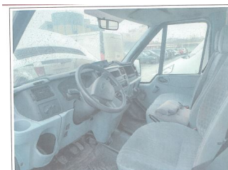
Фото 5. Общий вид салона